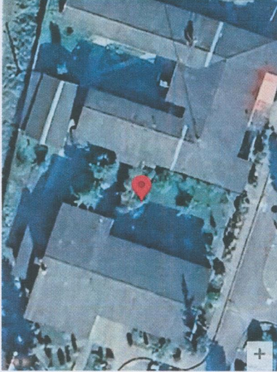
موقعیت و مختصات قرارگیری

Lat: 37.302115 Long: 49.335792 پلوار معلم, دهستان کسما, استان گیلان, 35335-43631, ایران, 2024-08-21 19:33:07 GMT+03:30